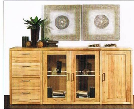
Abb. Q4, B: 216,0 H: 100,4 T: 40,6cm Sideboard, Glaskantenbeleuchtung 2.250,- 2.687,-